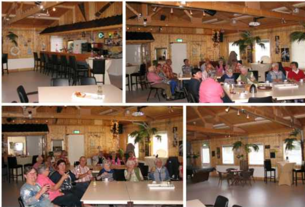
Catharijners - katern